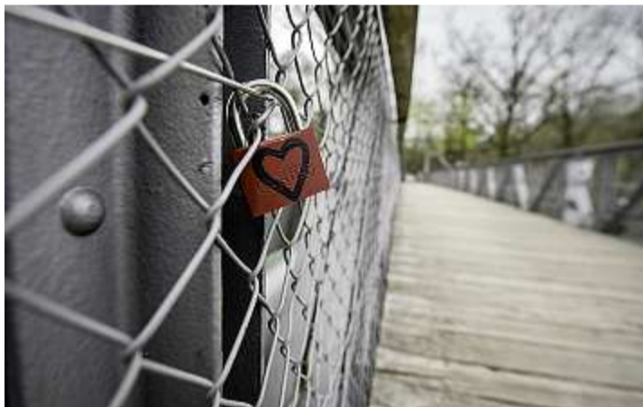
Nur vereinzelt hängen Liebesschlösser am Geländer des Schönaustegs. Die Schlüssel haben die Verliebten in die Aare geworfen.

In Deutschland ist bei Verliebten die Hohenzollernbrücke sehr