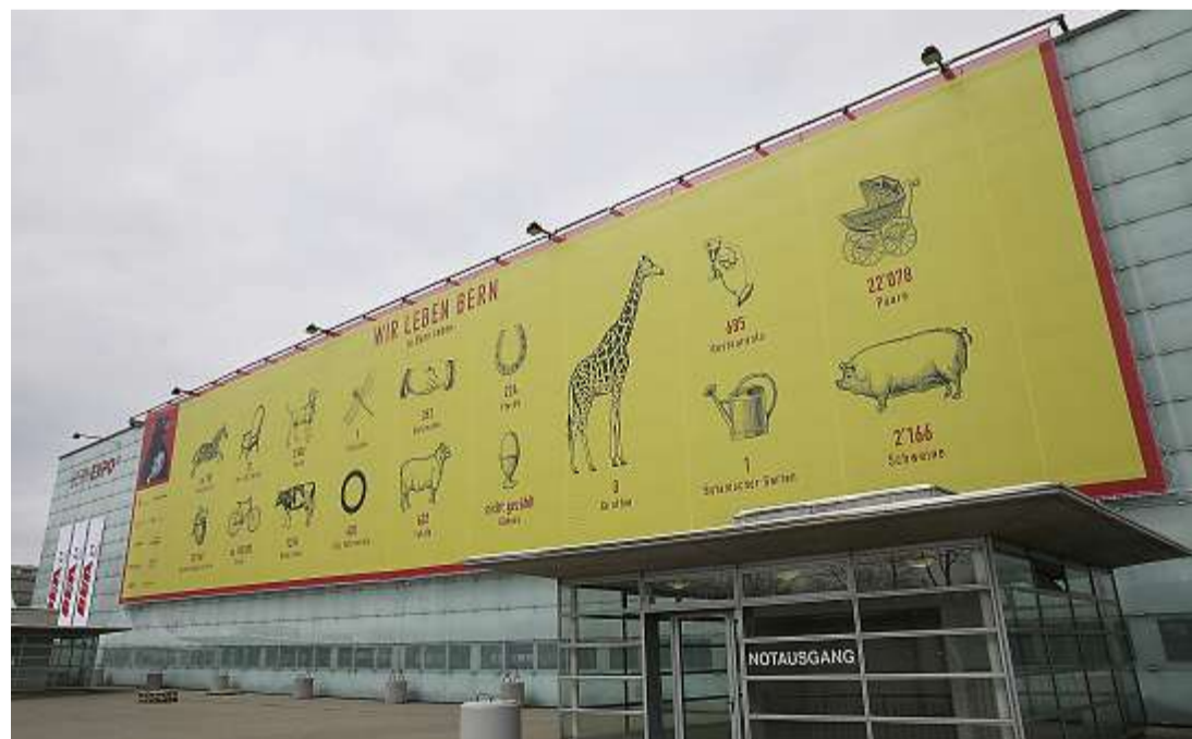
Willkommen im Tierreich: Die Besucherinnen und Besucher der BEA werden zur Begrüssung mit statistischen Angaben zum Leben in der Stadt Bern versorgt.